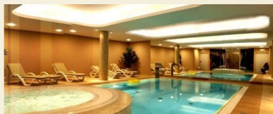
Crosna SPA - basen i jacuzzi