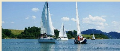
Jezioro Czorsztyńskie (12km)