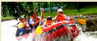
Tor wodny Wietrznica (13km)