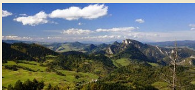
Pieniński Park Narodowy