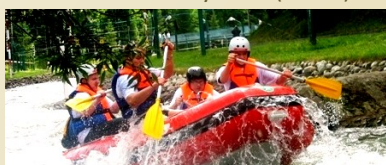
Tor wodny Wietrznica (13km)