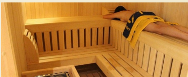
Crosna SPA - sauna