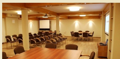
Crosna SPA - Sala konferencyjna