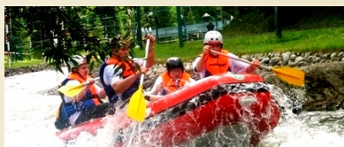
Tor wodny Wietrznica (13km)