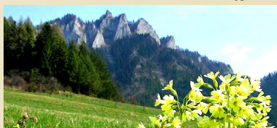
Pieniński Park Narodowy