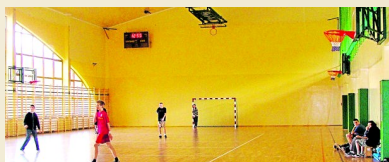
Sala gimnastyczna (1.5km)