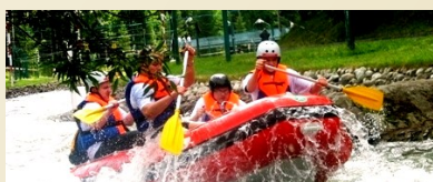
Tor wodny Wietrznica (13km)