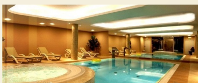
Crosna Spa - basen i jacuzzi