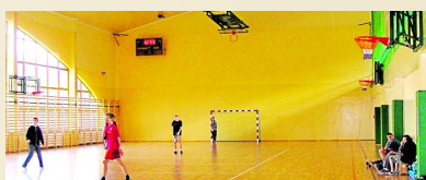
Sala gimnastyczna (1.5km)