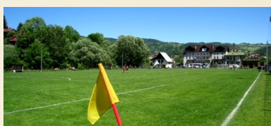
Stadion piłki nożnej (1.5km)