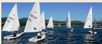
Jezioro Czorsztyńskie (12km)